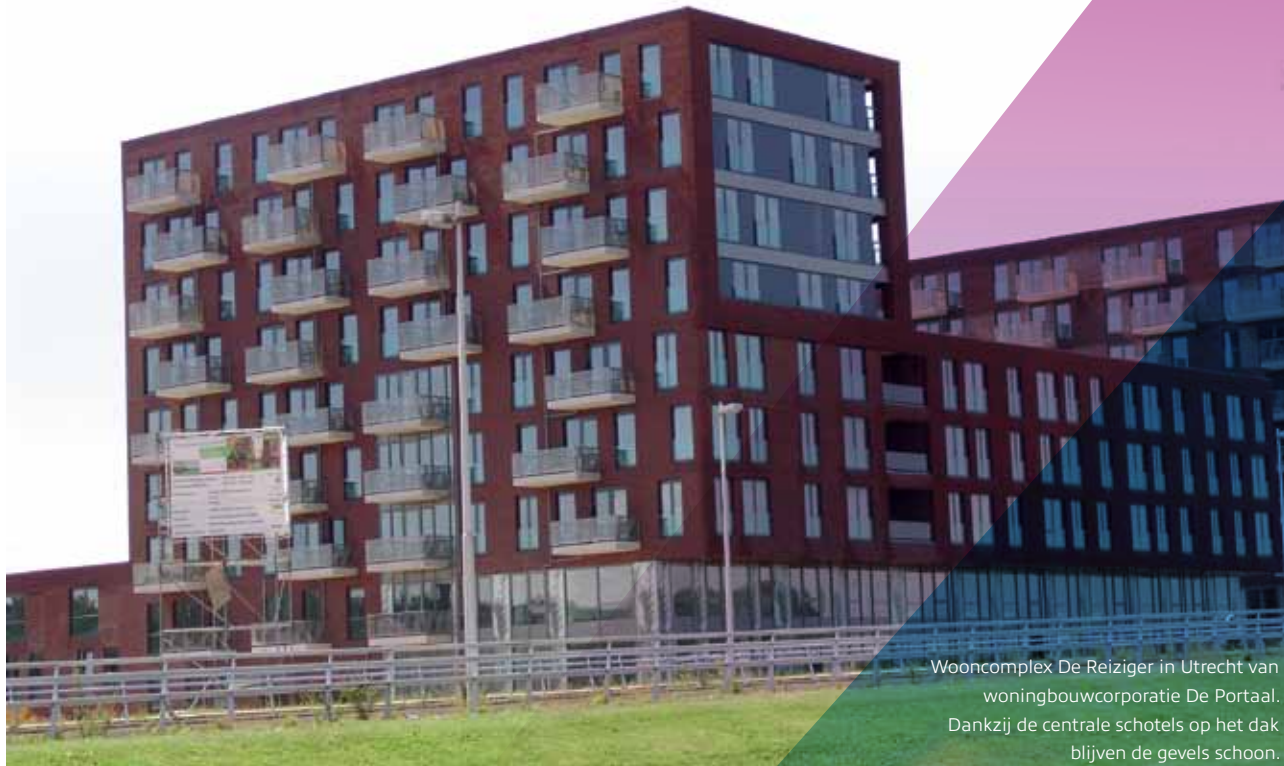
Wooncomplex De Reiziger in Utrecht van woningbouwcorporatie De Portaal. Dankzij de centrale schotels op het dak blijven de gevels schoon.